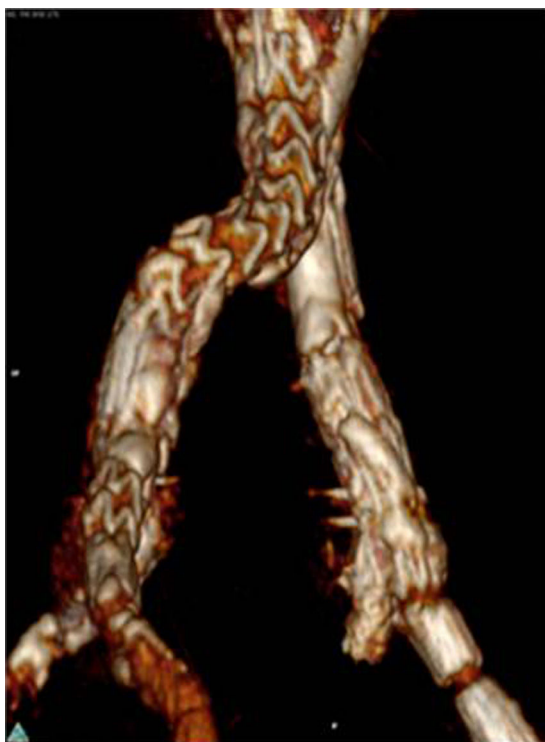
Figura 4 AngioTC com oclusão do stent da hipogástrica esquerda, em provável relação com kink .