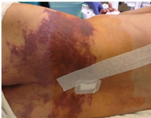
Figura 5 Agravamento das manifestações cutâneas compatíveis com isquemia pélvica irreversível.

Procedeu-se a drenagem de líquido (que não foi realizada previamente porque a avaliação inicial por neurologia sugeriu um quadro mais periférico – síndrome de cauda equina) e revascularização da hipogástrica via aspiração de trombo e angioplastia intra- stent , com stent expansível por balão ( Assurant Cobalt , Medtronic®). A angiografia final revelou permeabilidade de hipogástrica e ramos distais, apesar de algumas imagens de subtração sugestivas de trombo residual.