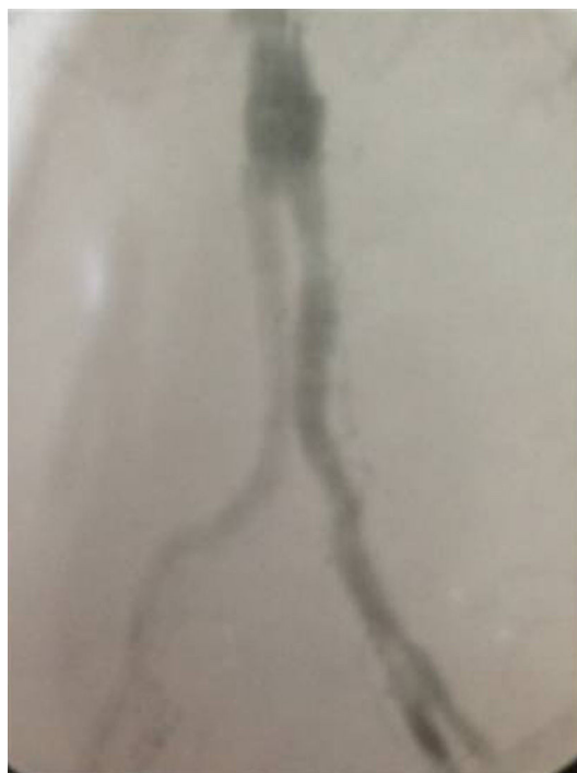
Figura 2 Angiografia final com hipogástrica esquerda revascularizada.