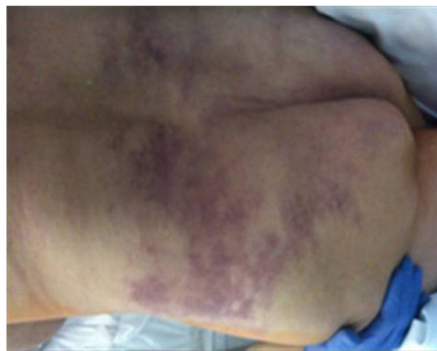
Figura 3 Aspetto mosqueado e zonas de cianose fixa da região lombossagrada.

O procedimento decorreu sem complicações e a angiografia final mostrava permeabilidade da hipogástrica revascularizada e escassa colateralidade pélvica (fig. 2).