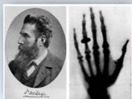
Comemorações do descobrimento da Raio-X - Novembro de 1895 - 2012